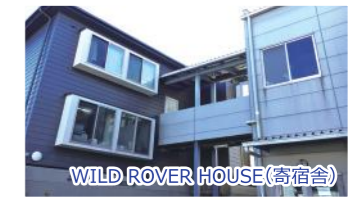
WILD ROVER HOUSE(寄宿舎)

トヨタ自動車、JR、日本航空、三井物産、日本生命、経済産業省など、大手有名企業や教職員などの公務員に多数就職しています。