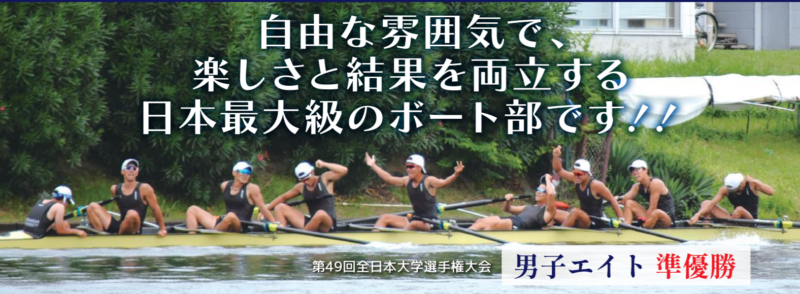
第49回全日本大学選手権大会 男子エイト 準優勝