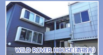
WILD ROVER HOUSE (寄宿舎)

部員による自治自立を重んじ、自ら運営を決定し、かつ底抜けに楽しい運営をしています。 上下関係に厳しすぎず、自由な雰囲気が魅力です。