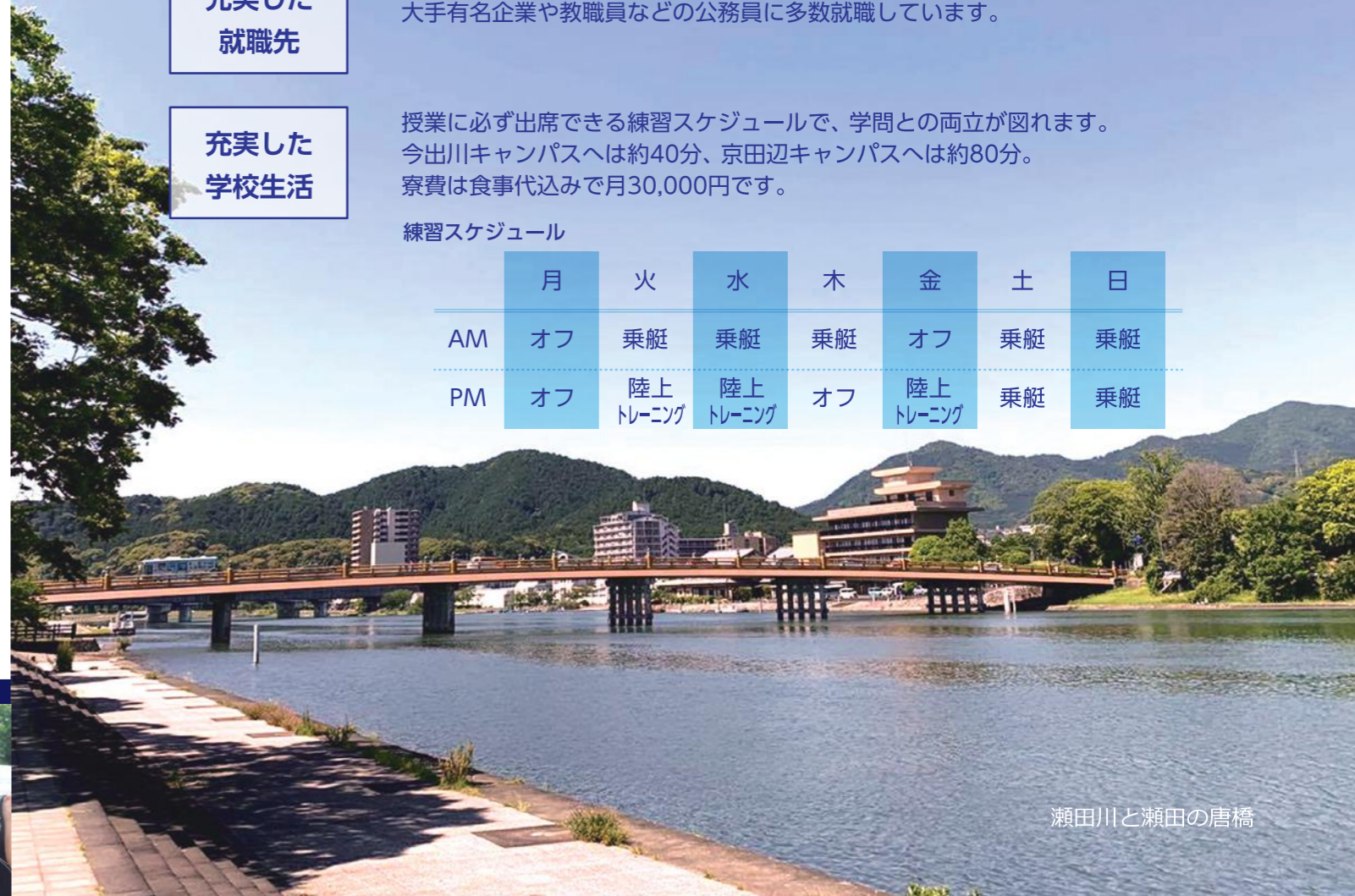
瀬田川と瀬田の唐橋